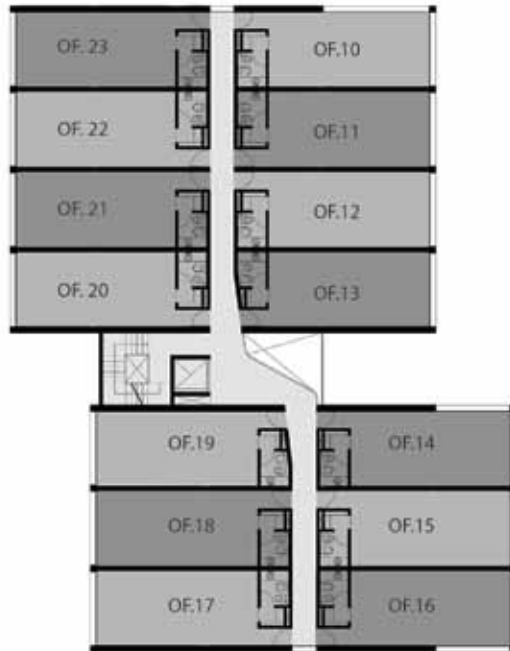
PLANTA ALTA 1 PISO